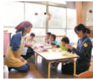
お友達と食べるのも楽しいね

公立保育園(土橋・中有馬・菅生)では、園で食べている給食を体験できる「親子でランチ」を行っています。みんなと遊んで一緒にご飯を食べられる他、保護者も離乳食のこつを学べます。0歳から就学前の子どもが対象。1回2組限定の人気企画です。日時や申し込み方法など詳細は区役所こども支援室にお問い合わせください。