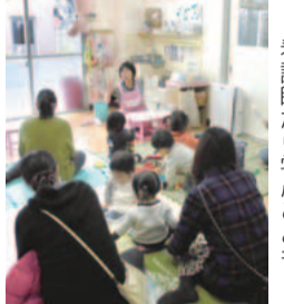
インフルエンザ予防を 看護師から学ぶことも

寒くなり風邪を引きやすい季節です。子どもの健康や食事について、区の公立保育園では栄養士や看護師がいつでも相談に乗ります。子育てで不安なこと、相談したいことがあったら、気軽に近くの公立保育園に行ってみてください。