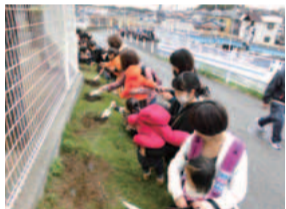
保育園前で菜の花の種植え

あそびの広場は他にもいろいろな企画を予定(下表参照)。予約不要で、誰でも気軽に参加できます。また、全公立保育園で園庭を開放中(祝日を除く月～土曜の9時半～16時)。安全な砂場や遊具で子どもを遊ばせてみませんか。絵本の貸し出し、身体測定も行っています。