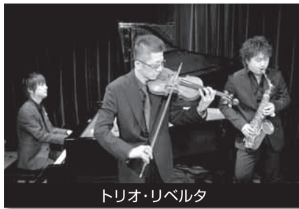
トリオ・リベルタ

その他にもオペラ、クラシック、ジャズ、演劇、ミュージカルなど充実の全28演目40公演が行われます。詳細は問い合わせるかホームページをご覧ください。チケット販売中。囲電話かホームページでアルテリッカしんゆりチケットセンター ☎955-3100(9時半～17時)。 [先着順] 囲市民・こども局市民文化室 ☎200-2280、FAX200-3248