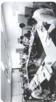
▲学校支援センターの担当職員にもヒアリングを行い、授業内外での地域との交流が明らかになりました。

“地域・世代間の交流”には、家庭教育や地域教育の重要性などが指摘され、まず区内の小学校を対象に地域との連携、地域の人材活用の実情のアンケート調査を行いました。