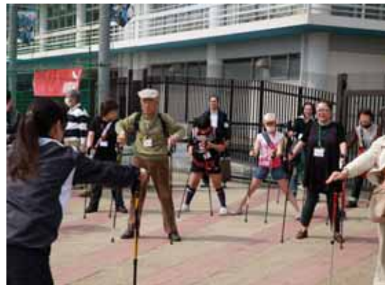
ポールウォーキング体験準備運動