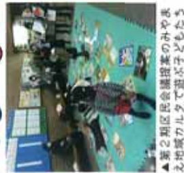
▲第2期区民会議提案のみやまえ地域カルタで遊ぶ子どもたち