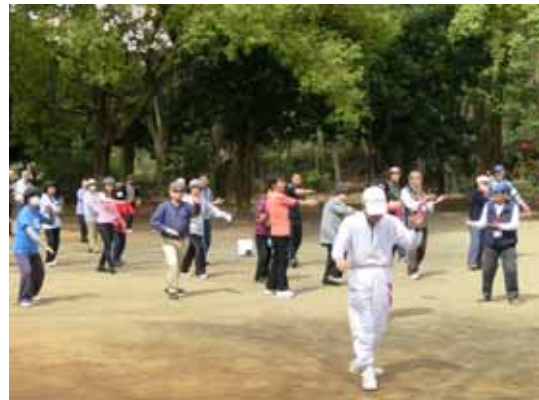
宮崎第4公園で太極拳を体験