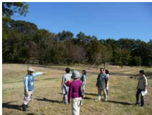
菅生緑地西地区（水沢の森）の広場