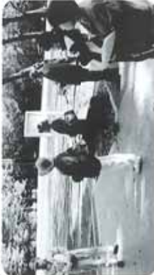
▲人づくりにつながっている花壇づくりや、学校と連携した自然体験活動などの活発な活動の説明を受けました。

“人づくり”には、目的意識を共有できるコンテンツづくり、情報発信の重要性などが指摘され、まず区内の既存の活動の現場の見学を行いました。