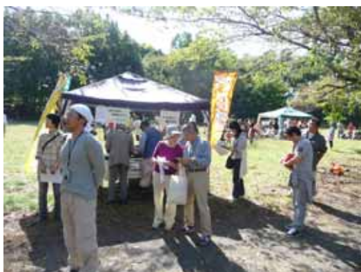
菅生緑地東地区へ集合

内容：区民祭のプログラムとして行われた水沢の森見学ツアーに各委員が個人で参加。水沢の森で活動をしている団体「水沢森人の会」のメンバーの説明をうけ、芋掘りや竹コップづくりなどの体験を通して活動の現場を学ぶ。