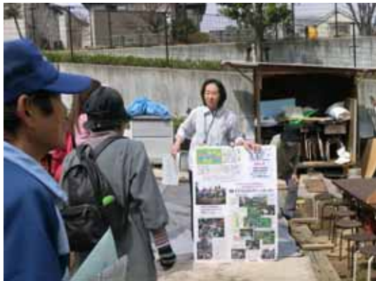
コミュニティガーデンで活動紹介