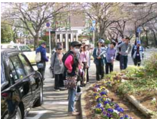
宮崎台駅前ガーデンを視察