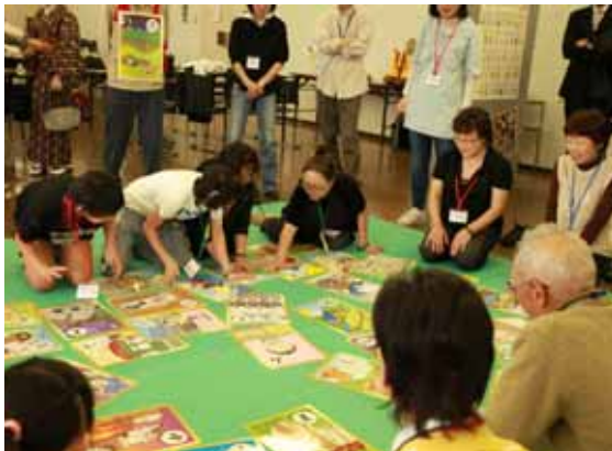
白熱したみやまえカルタ

2つのチーム対抗のプログラムを体験したことにより、チーム内の交流が更に深まったようでした。