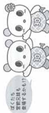
ほくたる宮前区民会議だよりを多量するかも！

※会場には保育ボランティアの方も参加いただきます ※ウォークラリーのみの参加を希望される方は当日12時半区役所大会場で受付（先着20人）