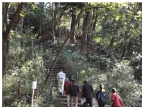
宮崎第4公園の斜面地