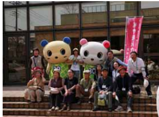
区役所に到着し、宮前兄妹と記念撮影