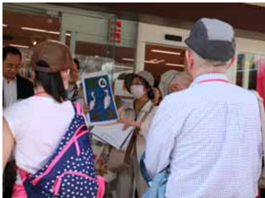
カルタで鷺沼の地名の由来を紹介