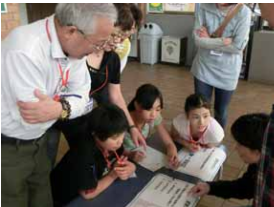
クイズの答えをチームで相談