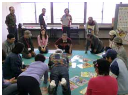
見つけた札に身を投げ出す姿も