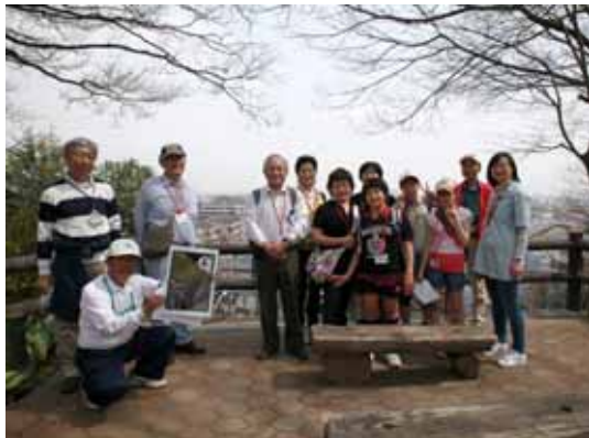
鷺沼北公園の眺望をバックに