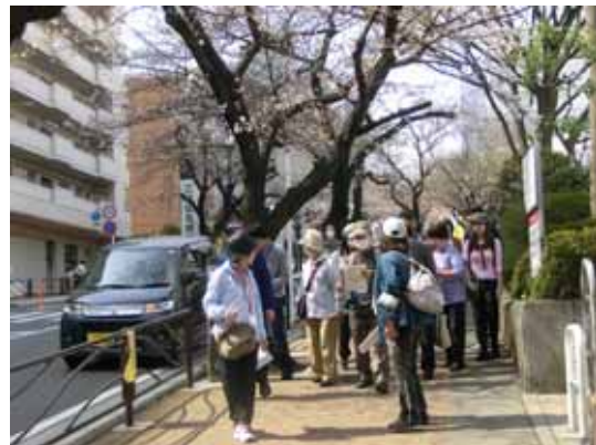
さくら坂を下る参加者たち