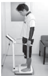
インボディ測定の様子

「インボディ」という機械で体成分を測定します。はだしで機械の上に乗るだけ。1分で結果が得られ、記録用紙に筋肉・体脂肪・体水分・基礎代謝量などが表示されます。宮前スポーツセンター