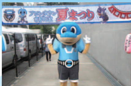
フロントタウンでお待ちしています

内容 キッズフットサルイベント、飲食販売(かき氷、焼きそばなど)、アトラクション(キック