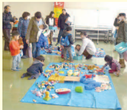
子ども楽しみながら学べます