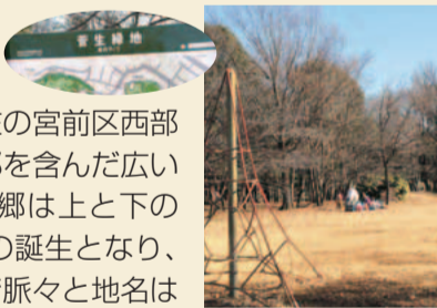
冬の陽だまり菅生緑地

のある古い地名です。その地域は、現在の宮前区西部と多摩区南東部、麻生区東百合丘の一部を含んだ広い範囲でした。江戸時代に入ると、菅生郷は上と下の菅生村に分かれ、明治時代には菅生村の誕生となり、範囲は変化しましたが、地名は現代まで脈々と地名はつながっています。その由来は、菅が多く生えて冬の日が暖かい菅生緑地場所だったことから「菅生」という名前が付いたと考えられています。菅は山や水辺に自生するカヤツリ草科の植物の総称で、葉の幅が広いものは菅笠などに、幅の狭いものは蓑の材料として、日常的に用いられていました。生活の役に立ち、人間にとって関心の深い植物が生える場所で、植物名が地名となった例は全国的にも多く見られます。