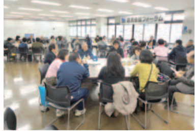
皆様のご意見を審議に反映していきます

よりよい暮らしを目指してまちの課題解決を審議する区民会議。今期は2つの部会で、だれもが暮らしやすいまちづくり、区の魅力探訪をテーマに審議を進めています。