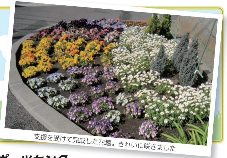
支援を受けて完成した花壇。きれいに咲きました

の様子分かる写真を添え、8月31日(必着)までに直接か郵送で〒216-8570宮前区役所地域振興課 ☎856-3125、FAX856-3280。[選考] ※申込書は8月3日から区役所などで配布。提出書類は返却しません。支援決定団体は10月1日(木)に開催する説明会に参加してください。