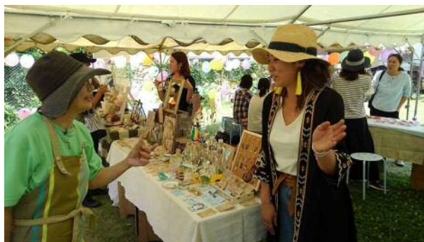
クラフト販売コーナー