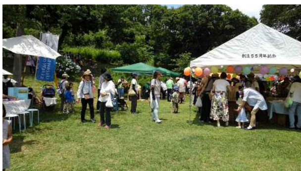
会場の様子（たくさんの来場者があった）

内容： 手作りクラフト（ママさんたちの作品他、バルーンアート、切り絵なども） カレーやトルティーヤの販売（はぐるま工房）、100%ジュースの販売、 バイオリン演奏、ゲームコーナー、かわさき色輪っかなど