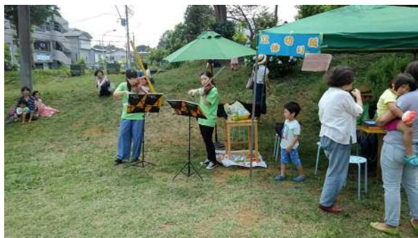
大学生によるバイオリン演奏