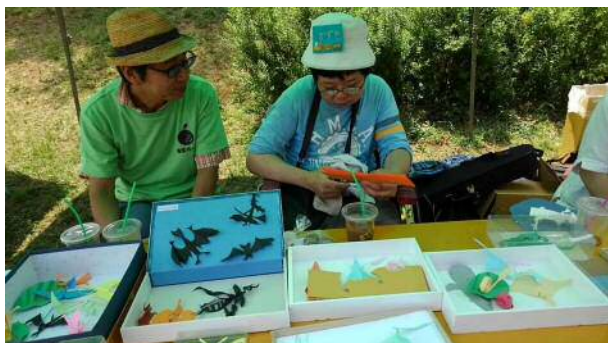
切り絵実演コーナー