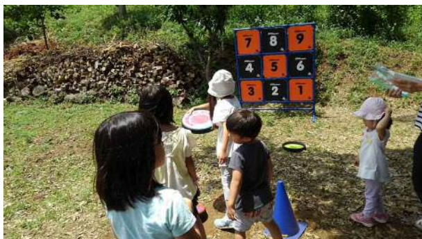
ゲームコーナーで遊ぶ子ども達