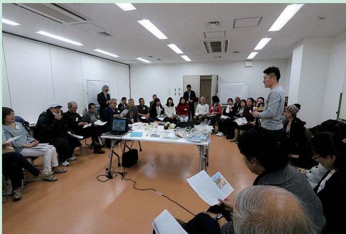
活動や作品の紹介に熱心に聞き入っていました

分科会終了後の休憩時間にも名刺交換したり、声をかけ合ったりする参加者の姿が見られました。