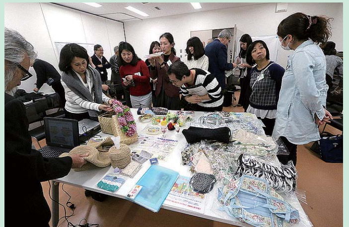
お互いの作品に興味津々の参加者たち

最初に自己紹介を全員で行いました。作品等をお持ちいただいた参加者も多く、その出来栄えに感心する声が上がったり、「自分たちのイベントや企画にぜひ出店・参加して欲しい」と他の参加者に呼びかけたりする場面などがみられ、互いに「交流や発表の場を拡げたい」という思いを語り合う場となりました。