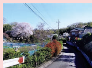
第11回優秀賞作品「春」