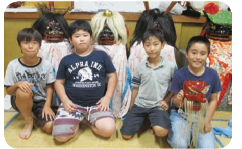
獅子舞を踊る子どもたち。3カ月前から練習を重ねる

保存会が継承する獅子頭の一つは、江戸時代初期のものとして推定されている。当初、初山正八幡社に奉納されていたが、明治末期に菅生神社に初山正八幡社が合祀されたあとは、10月の第1日曜日の菅生神社例大祭で奉納されている。