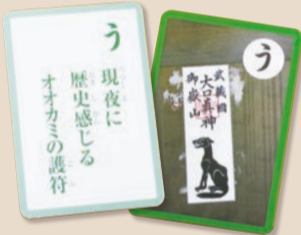
(宮前平中学校区版)