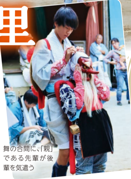
舞の合間に、「親」である先輩が後輩を気づかう

貸出・販売(税込1,000円)はこちら 区役所地域振興課 ☎856-3134 FAX 856-3280