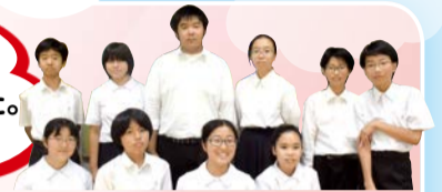
宮前ねぶたを作成した、宮崎中の生徒さん