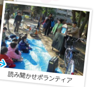
読み聞かせボランティア