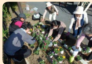
まちづくり協議会 「花とみどりの委員会」

囲5月31日(必着)までに、区役所などで配布中の申込書を直接、郵送、FAXで〒216-8570宮前区役所地域振興課 ☎856-3125、FAX856-3280。[選考]