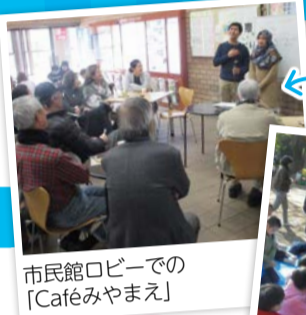
市民館ロビーでの「Caféみやまえ」

市民館では、子育てのこと、地域のこと、平和のことなど、幅広い講座を開催しています。区民の皆さんが企画提案し運営する講座もあります。講座をきっかけに、新しいグループを立ち上げて、やりたかったことをかなえる人たちもいます。