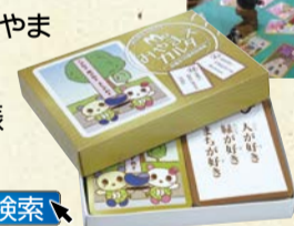
ジャンボカルタも貸し出し中

幅広い世代が地域の資源を掘り起こし、作成された「みやまえカルタ」。地域資源、まちのスポットに関する豆知識が凝縮されていて大人も子どもも楽しめます。区役所1階地域振興課にて販売(1箱1,000円) 貸し出しを行っています。 絵札・読み札は区ホームページで公開中