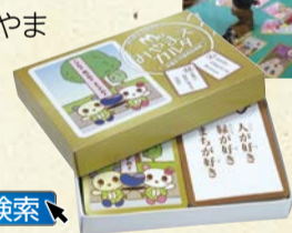
ジャンボカルタも貸し出し中