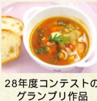
28年度コンテストのグランプリ作品

宮前区産農産物の活用や、農を通じた地域のコミュニティづくりを目指し、料理教室やコンテストなどのイベントを企画・運営します。月1~2回程度の会議。 ☎随時、直接か電話で宮前市民館 888-3911、FAX856-1436