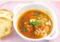
28年度コンテストの グランプリ作品

5月15日から直接か電話で宮前市民館 ☎888-3911、FAX856-1436