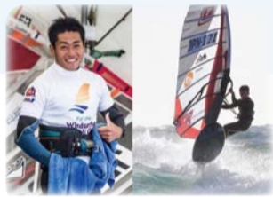
ウインドサーフィンプロランク2位の中井忠則選手

パワーライフスタジオで「スラローム競技」のトレーニングサポートと指導を受けています。体を動かすと気持ちいいですよ!