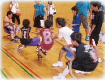
プロレスラーと力比べ!

犬蔵・宮前平・向丘中学校区を拠点に活動しています。それぞれの目的や志向に合わせてトレーニングできる「パワーライフスタジオ」や、小学生体育塾、幼児体育、健康体操教室、車いすスポーツなど、子どもから高齢者まで楽しめる教室やイベントを開講しています。