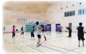
バドミントン教室