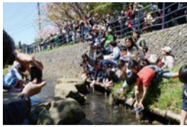
第12回審査委員長特別賞

応募方法 作品を2Lサイズで印刷し、裏面に公共施設などで配布しているチラシの応募票を貼り付けてください