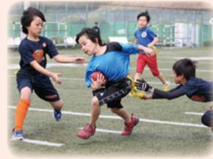
フラッグフットボール