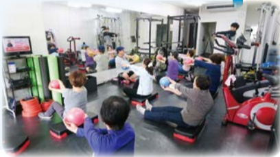
「パワーライフスタジオ」でのトレーニング