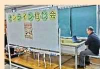
オンライン相談ブース(R7)

市民館等での市民講座をオンライン中継し、質疑応答も含めて出張所で参加できる取組を令和7年度から始めました。また、地域活動団体と連携して実施するイベントで、区役所とオンラインでつなぎ相談を受けられる取組や、オンライン申請等のサポートを行う取組を試行的に実施しています。