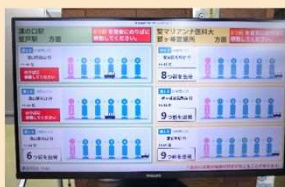
市バス運行状況の表示(R7)