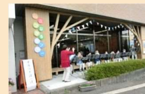
向丘つながるサンデー(R5~)