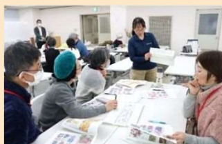
花壇ボランティア講座(R5~)

市民館や地域団体と連携した「スマホ講座」「花壇ボランティア講座」「相続講座」等を開催し、生涯学習の機会を提供しています。