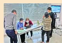
オンライン申請等ブース(R7)

向丘出張所で行われるイベント等の情報は、 市ホームページ・facebookで発信しています！