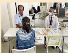
むかおカフェ相談コーナー(R4~)

区役所の保健師等の専門職、地域のボランティアと連携した子育てや健康等に関する出張相談を実施しています。