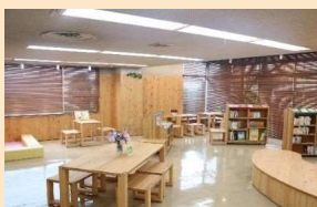
木質化リノベーション(R4)

地域の居場所として、立ち寄りやすく親しみやすい空間になるよう、木質化リノベーション、トイレ・給湯室等の改修を実施しました。令和7年度から乗換利便性の向上を目的として、出張所内にバス運行状況を表示するためのデジタルサイネージの設置を行いました。