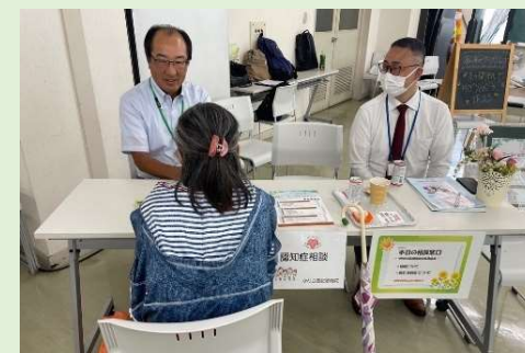
「むかおかフェ」相談コーナー(R4～)

区役所の保健師等の専門職、地域のボランティアと連携した子育てや健康等に関する出張相談を実施しています。