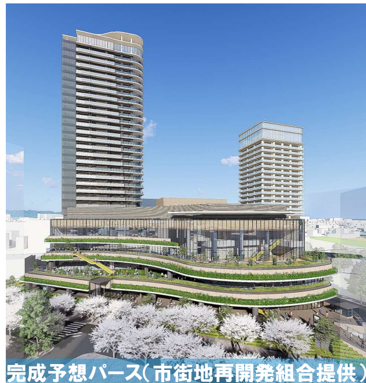
完成予想パース