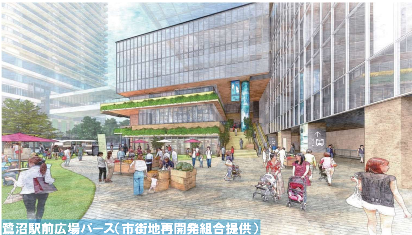
鷺沼駅前広場パース

鷺沼駅前の再開発 とあわせて 宮前区役所、市民館・図書館の鷺沼駅前への移転 など宮前区全体の将来を見据えた取組を進めています