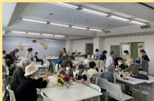
毎月第3水曜日 出張所会議室で開催される「むかおかフェ」(R4～)

地域団体主催による定期的な交流イベントの開催や花壇ボランティアによる花壇づくりの活動など、地域の活動や居場所となる取組を行っています。