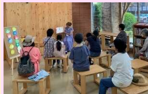
毎月出張所ロビーで開催される「おはなし会」(R4～)

図書コーナーを設置し、地域の図書ボランティアと連携した「おはなし会」の開催、本棚を貸し出す「みんなの本棚」を実施しています。