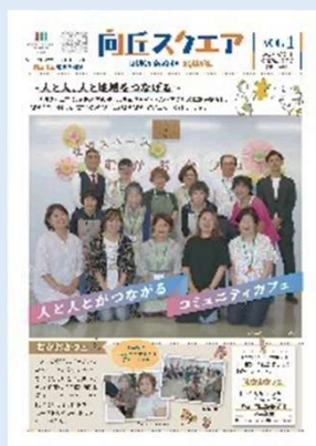
地域のさまざまな活動団体やイベント情報を紹介する「向丘スクエア」(R5～)

Facebook、イベント情報の掲示板、地域情報紙「向丘スクエア」等を通じて地域情報の受発信をしています。