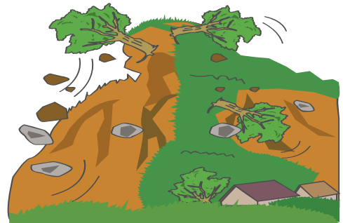
がけ崩れの前兆は…