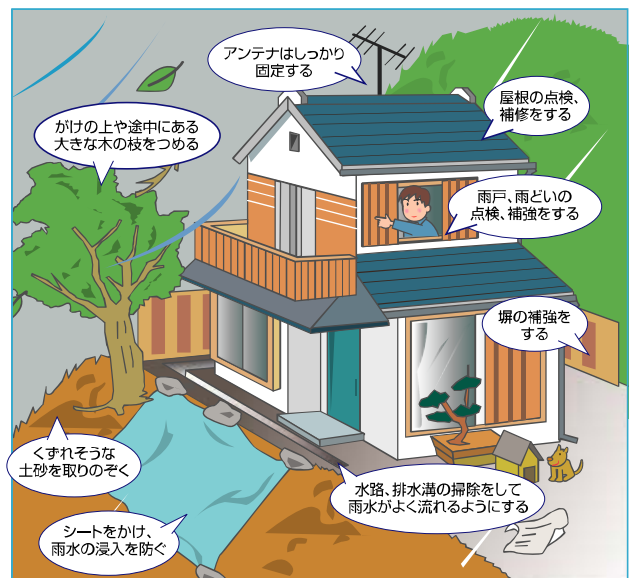
「備える。かわさき〈保存版〉」より抜粋

台風の季節になる前に、家の中や周囲を確認し、危険なところは早めに対策をしておきましょう。