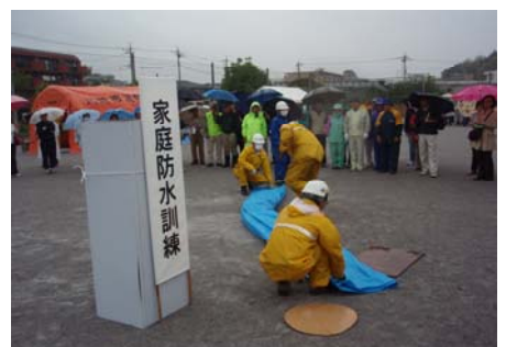
平成21年度水防訓練の様子（麻生区で開催）

日時・場所・訓練内容等、詳細につきましては今後市政だより等でお知らせいたします。