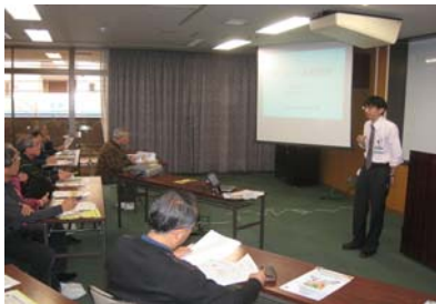
ぼうさい出前講座