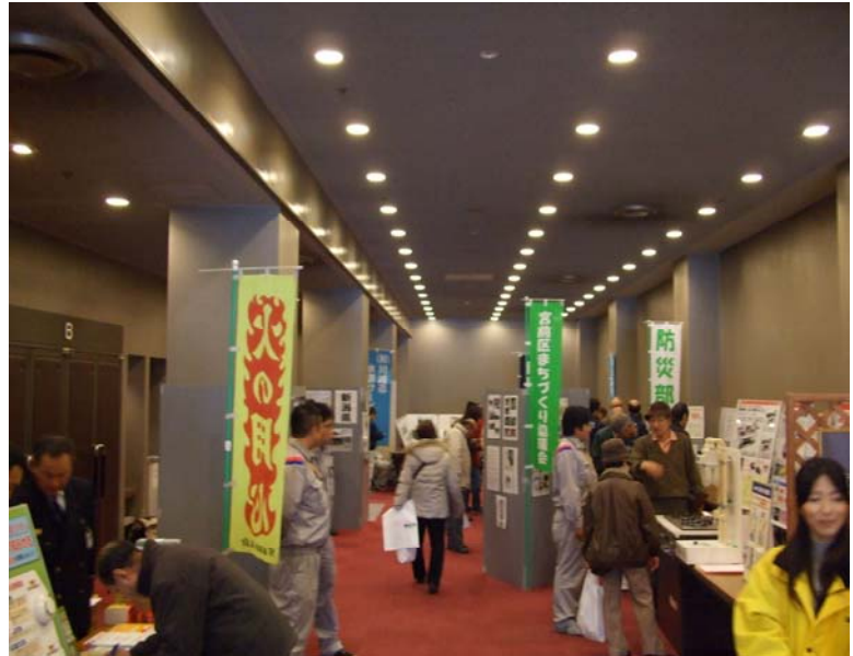
防災展示・実演会場