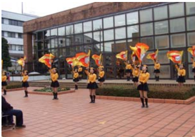
カラーガード隊による演舞