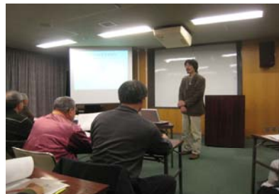
防災シミュレーション講座