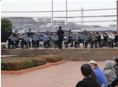
消防音楽隊による演奏

平成22年1月21日（木）正午から午後5時まで、宮前市民館におきまして、防災について手軽に学べる「平成21年度宮前区防災フェア」が宮前区まちづくり協議会と宮前区の共催により開催されました。