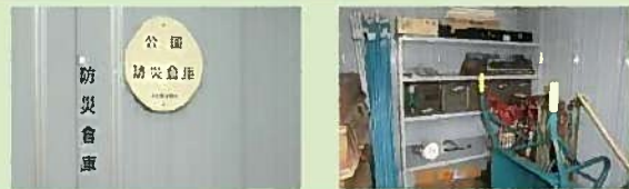
防災倉庫の中身を見せていただきました

GHには1000世帯以上の住民がいるので、備蓄も4ブロックに分けて行っています。自主防災組織が備えているものは仮設トイレ、担架、トランシーバー、スコップ、発電機など避難や救護に使用するための資機材です。非常食、飲料水等の備蓄とラジオ、ヘルメットなどは各家庭で備えるようお願いしています。資機材の点検は資機材管理部が定期的に行い、不良品の交換、必要なものの購入等を行います。