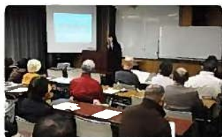
前回の防災フェアの様子 左上より： ○起震車体験 ○ぼうさい出前講座 ○川崎市消防音楽隊によるオープニング ○大ホール受付