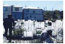
第16回審査委員長特別賞 「春よ来い 早く来い!!」

場所 宮前市民館2階市民ギャラリー ☎区役所地域振興課 ☎044-856-3125 ☎044-856-3280