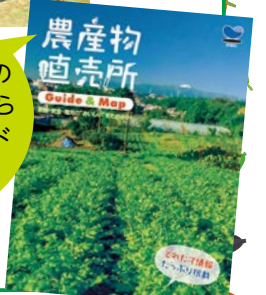
農産物直売所 Guide & Map