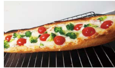
グランプリに輝いた「パンがまるでお皿のよう...? お皿まで食べられる!? 冬野菜グラタン」