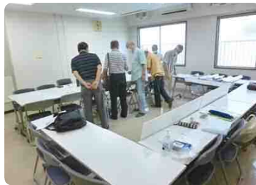
集会スペースはさまざまな活動で使用されています

区民活動支援コーナーと集会スペースは、地域活動の交流の場になっています。登録制で、音楽活動、書道、詩吟、ストレッチなどで活用されています。登録方法など、詳細はお問い合わせください。