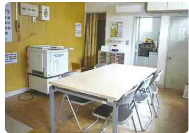
区民活動支援コーナーはコピー機なども設置されています