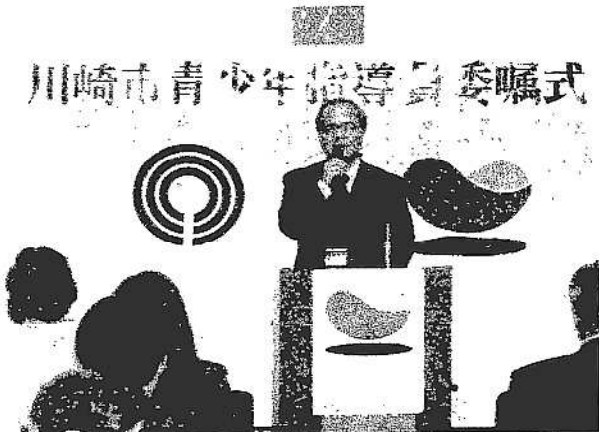
委 嘱 式 の 風 景