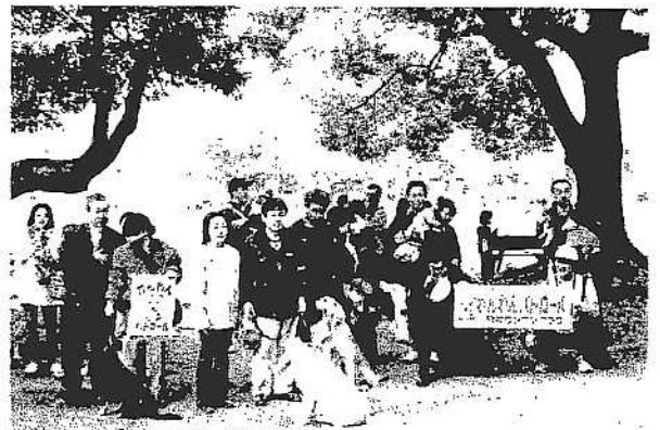
公園でのわんわんパトロール

9月に入って、平小学校子ども安全安心会議を構成するグリーンハイツ自治会では子ども110番の増設と共に、平小学校の下校時間に合わせて、地域ボランティア57人が毎日交代で、主要な道路8箇所に立ち、安全パトロールの取り組みを始めました。