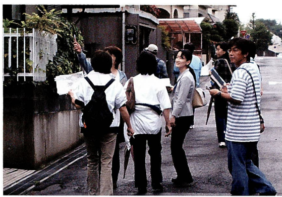
6月の宮前区青少年指導員連絡協議会研修会 (地域安全マップ作りのフィールドワーク)