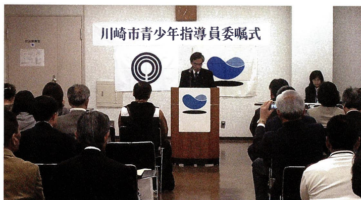
■ 委嘱式の風景 ■