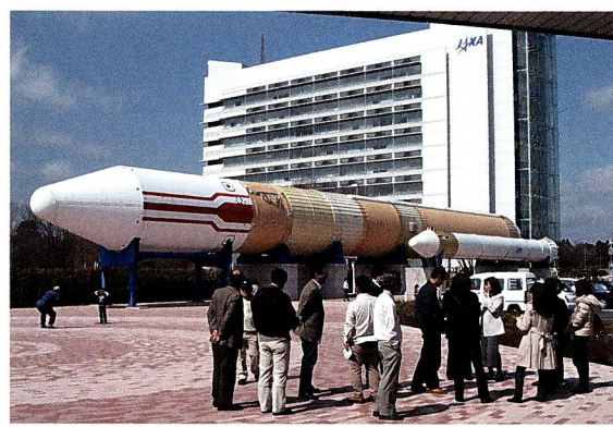
3月の宿泊視察研修会(筑波宇宙センターにて)