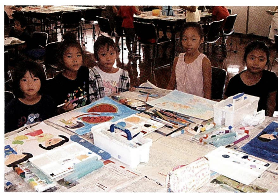
11月の宮前地区青少年作品展 (宮前市民館4階第1、2、3会議室にて) 出展のためにみんな一生懸命作成中です