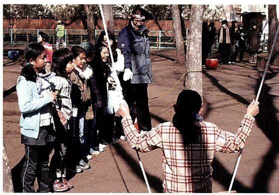
2月のディスカバーウォークみやまえ (野川第3、4公園にて)