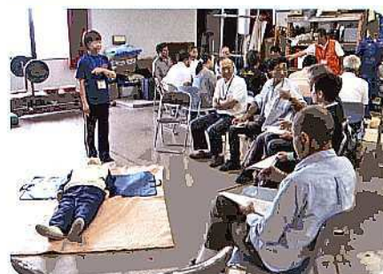
倒れた人を前に、心肺蘇生の手順の実技講習を受けています。