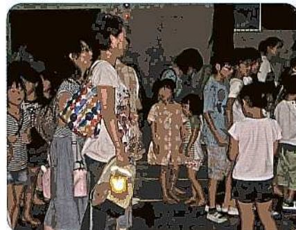
南野川小学校体育館(7/25):映画会が終わり帰宅する所です。