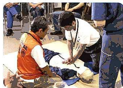
実際に心臓停止したモデルに胸骨圧迫をしている所です。