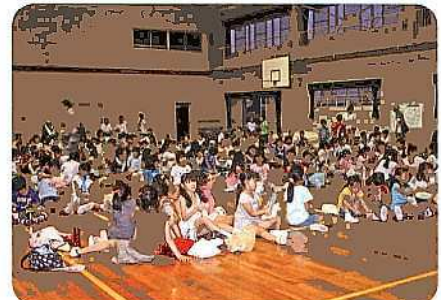
宮前平小学校体育館(7/26):映画の前に注意事項を受けています。

巡回映画会開催にあたり、町内会・自治会の役員さん、子ども会の役員さん、スポーツ推進委員さん、お子様に同伴した、お母さん、お父さんなどたくさんの関係者のご協力により安全無事に開催できたことを心より感謝申し上げます。