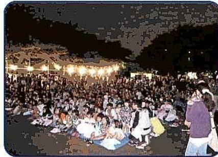
小台公園(7/21):子どもたちが公園いっばいに集まりました。