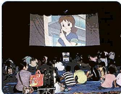
三ツ又広場(7/24):交通安全の映画を見えています。