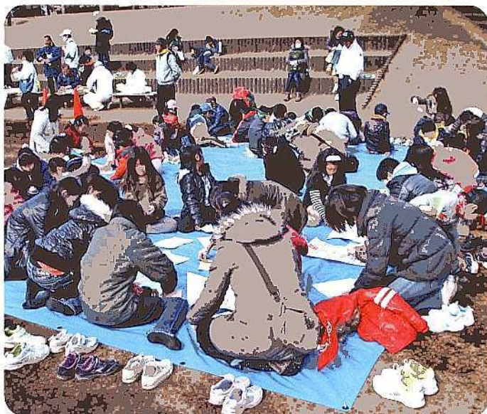
たこ・紙飛行機作成中風景

子どもたちが紙飛行機や凧作りに熱中した後、自ら作ったもので楽しんでいる姿を見て、大人も童心に戻り、子どもと一緒に楽しむことができました。開催にあたり子ども会の役員さん、保護者のお母さん、お父さんなどたくさんの関係者のご協力により安全で無事に開催できたことを心より感謝申し上げます。