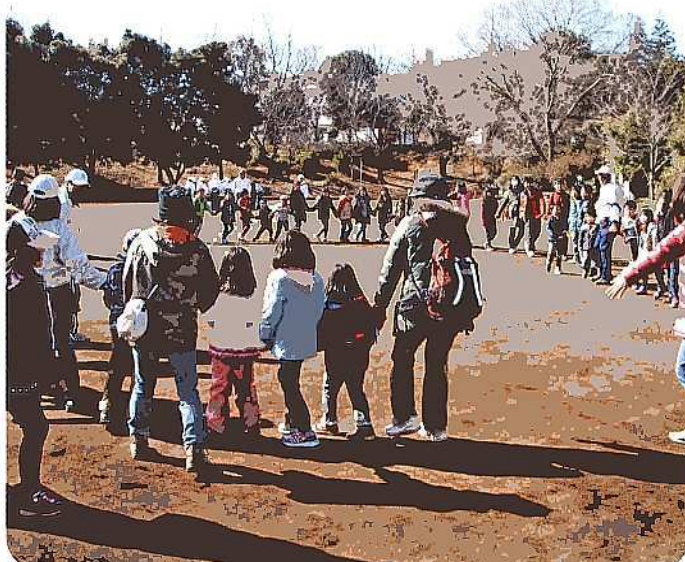
フォークダンス風景