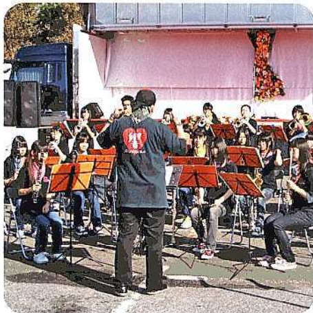
舞台での演奏風景

私たち青少年指導員会は、前日準備と、当日は総合案内、舞台進行、パレード招集・解散、後片付けのお手伝いをさせていただきました。