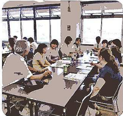
分科会の意見交換風景