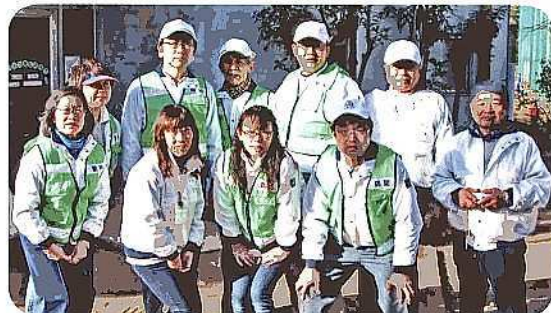
青少年指導員の巡回パトロール風景

「地域の青少年は地域で守る」の視点から4地区(野川・有馬・宮前平・宮崎)交代で毎週実施しています。