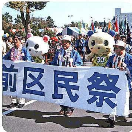
パレード行進風景