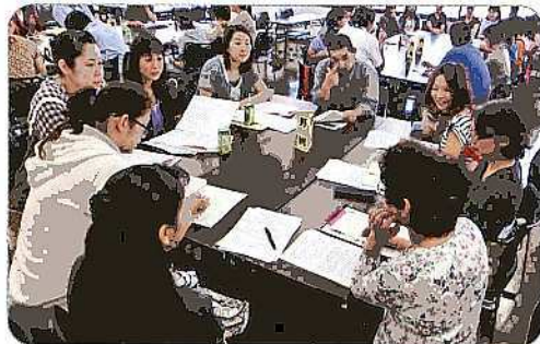
分科会の意見交換風景

平成25年9月28日(土)にPTA・校外委員と青少年指導員が「子どもたちの安全を守るために」～地域としての取り組みを考える～というテーマで情報交換会