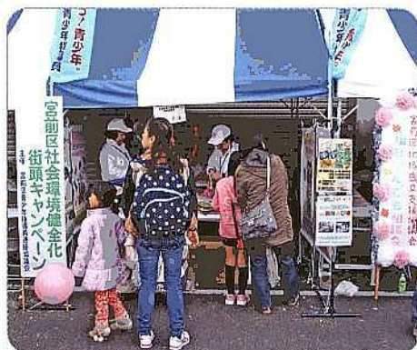
啓発キャンペーン風景