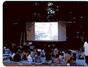
◆土橋2丁目公園(宮前平地区)