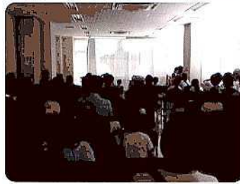
◆アリーノ(有馬地区)