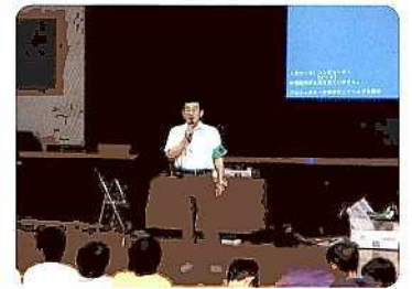
◆南野川小学校では防犯講話を開催(野川地区)