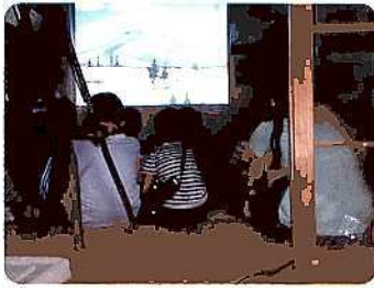
◆三ツ又会館(宮崎地区)

本年度の上映作品は「ブンナよ木からおりてこい」「日本昔ばなし」等を上映しました。