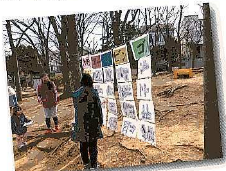
フィールドビンゴ