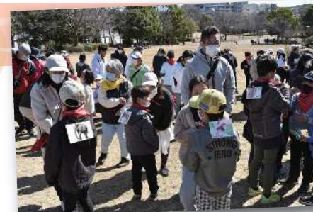
ネイチャーゲーム