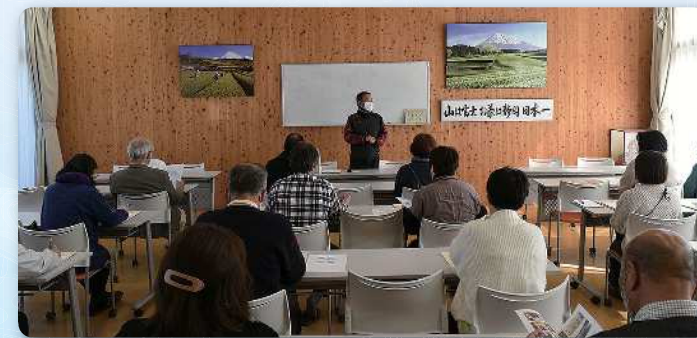
更生保護法人少年の家

6年ぶりに開催した宿泊視察研修会には22名が参加。更生施設などを見学し、大いに学ぶことができました。楽しくかつためになる2日間でした。