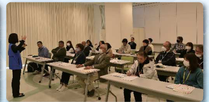
静岡市子どもクリエイティブタウンま・ある