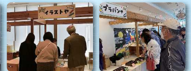
ま・ある「こどもバザール」の一部