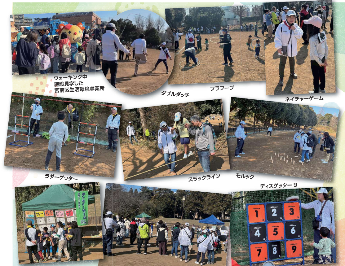
ウォーキング中 施設見学した 宮前区生活環境事業所

今後も地域の子どもから大人まで一緒に楽しむことのできる活動をしていきたいと考えております。