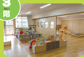
地域子育て支援センター つちはし