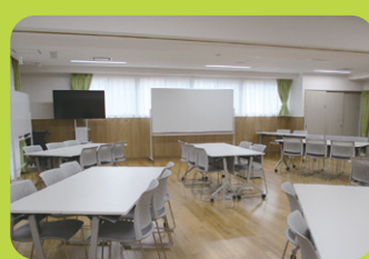
あおぞらルーム 研修室・事務室