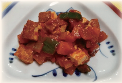
なま あ やさい と ま と そー す に 生揚げと野菜のトマトソース煮