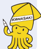
市選挙マスコット「イックン」

地方公共団体がそれぞれに選挙を行うと、有権者も混乱してしまう恐れがあること、そして、選挙への意識を全国的に高めることを目的に一斉に選挙が行われたのが始まりです。