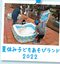
夏休み子どもお宝ランド 2022