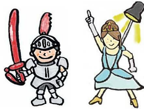
バルーンナイト ステージ姫