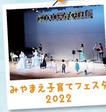
みやまえ子育てフェスタ 2022