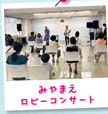
みやまえ ロビーコンサート