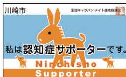
受講するともらえるカード

また、さまざまな職種の職員が専門性を活かして各種の相談を受けるとともに、関係機関などと連携し、きめ細やかな支援を行っています。