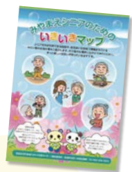
みやまえシニアのためのいきいきマップ