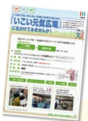
いいい元気広場場所一覧