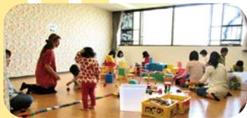
おひさま広場(宮前平)