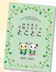
子育てガイド「とことこ」