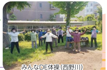
みんなDE体操(西野川)