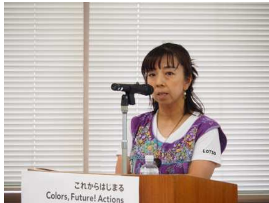
実際に親の終活を体験された方々に体験談を共有いただきました