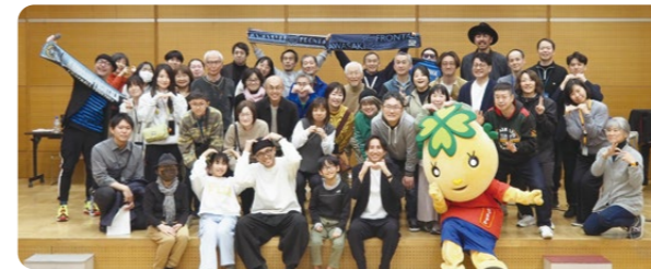
川崎フロンターレの元選手にもお越しいただきました!