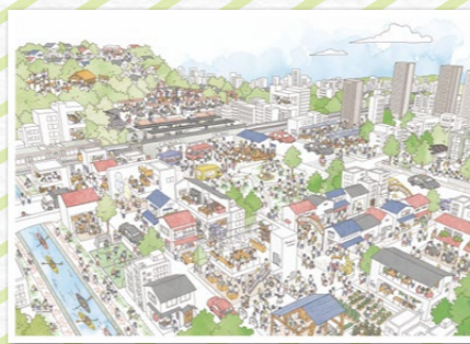
イラスト：イスナデザイン

川崎市では、10年後の未来を描いた「希望のシナリオ」の実現に向けて、持続可能な暮らしやすい地域を実現するため、平成 31 (2019) 年に「これからのコミュニティ施策の基本的考え方」をまとめました。これを受けて、多様な主体の連携により課題解決をめざす新たなしくみとして、各区で「ソーシャルデザインセンター (SDC)」が立ち上がっています。