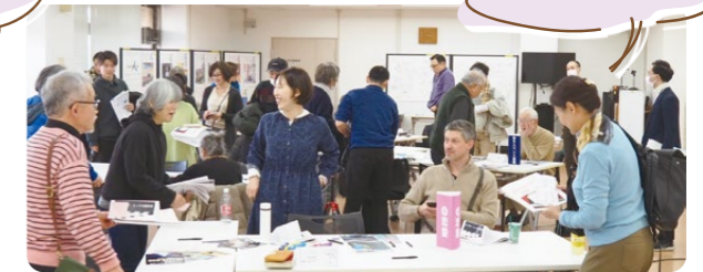
交流会では、地域の方とゆるくつながれます!