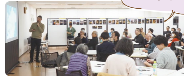
ゲストを呼んで、様々なお話を聞きます。