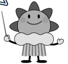
気象庁 マスコットキャラクター はれるん