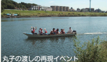
丸子の渡しの再現イベント

中原街道を通る人々にとって、昭和10年に丸子橋が完成するまでは渡しや川を渡る唯一の交通機関でした。数多くあった多摩川の渡しの一つでした。渡し場の近くに松原・青木根集落がありましたが大正9年の築堤で姿を消しました。