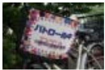
「PTA自転車ステッカー運動」 「子ども110番の充実」