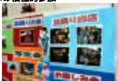
盆踊りなどの参加