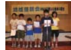
地域防犯会議 (PTA座談会)