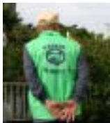
「宮内・中原安全パトロール隊」