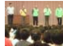
朝礼での紹介風景