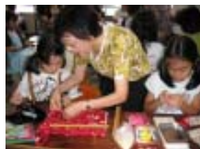
(ふれあいスクール)