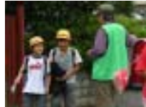
「下レイドマーク の緑ベスト」