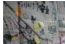
(なかはら安全マップ)

なかはら安全マップの作成 PTAと安全パトロール隊 との連携 市教育委員会による メール配信サービスの周知