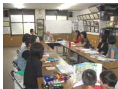
子ども会保護者との自転車利用マナー勉強会の様子 (小杉町二丁目町内会)