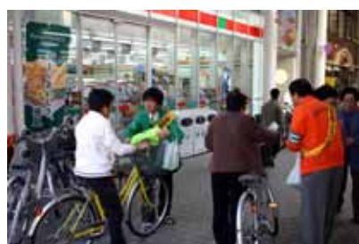
武蔵新城駅周辺でのキャンペーン活動