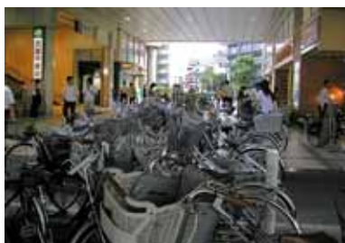
対策前の武蔵中原駅通路