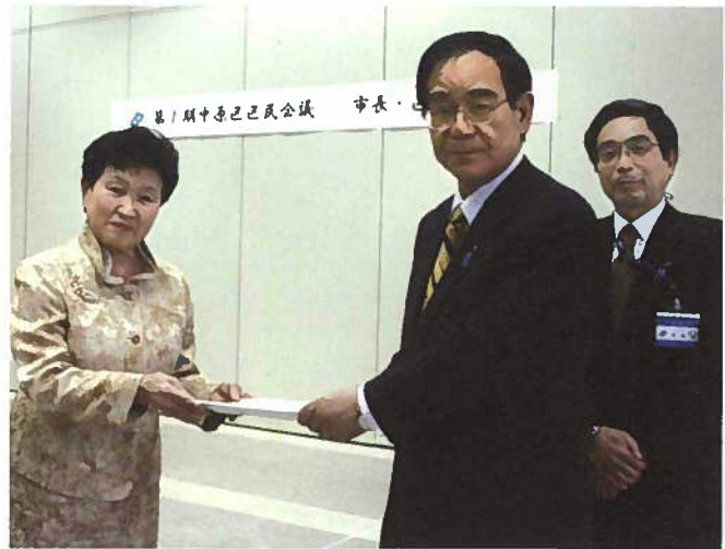
平成20年3月27日に開催した市長・区長報告会

今後も元気いっぱい、この活動をするとう長生きできるというような感じをつくってってください。どうもありがとうございました。よろしく願いいたします。