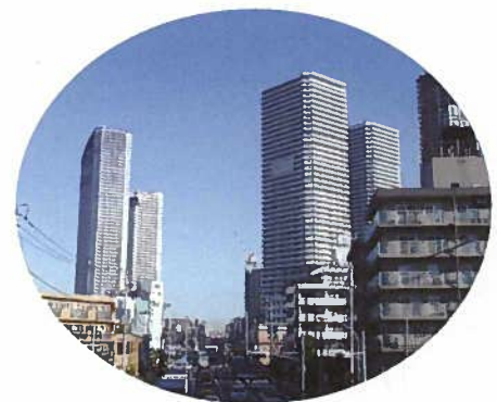
開発が進む武蔵小杉駅周辺

●区民会議の委員となり、委員さんが責任のもとにどれだけ人間の生きていくということに関するきめ細やかな活動をなさっていること、またそれに対して努力なさっていることが分かり私の胸を打つことが多かった。こんなに大勢の方が動いて大勢の方の力で支えられていることがしみじみ感じられたことが、委員になって最大の私の成果です。