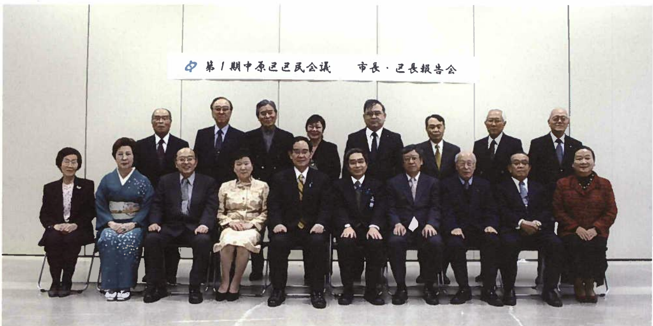
第1期中原区区民会議委員