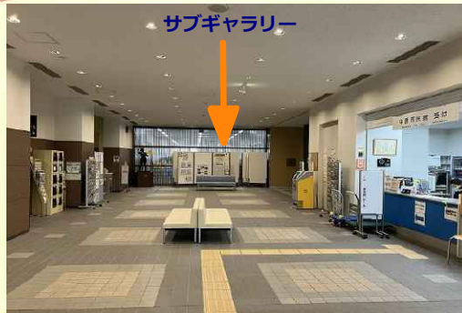
中原市民館のエントランスホール