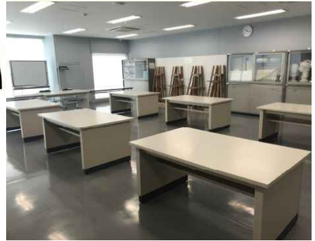
料理室 調理台(IHコンロ)、調理器具、食器類などを備えています