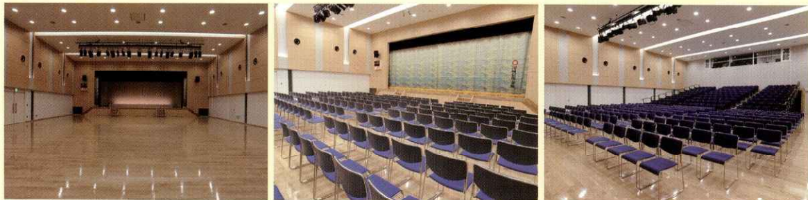
椅子を収納でき、フロアをフラットにして使用できます