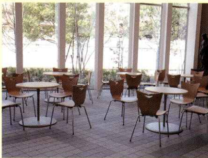
休憩や交流用のスペース