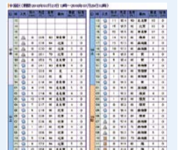
■ ピンポイント天気予報