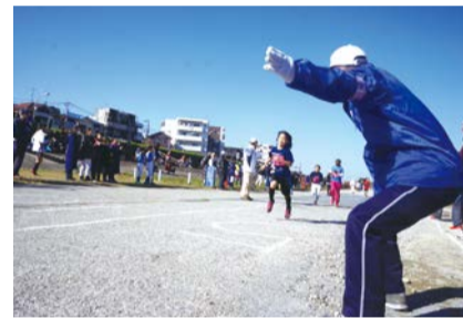
多摩川ロードレースマイペース大会