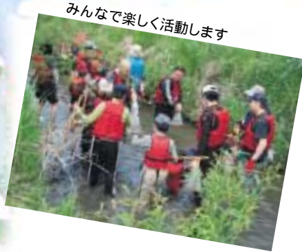
みんなで楽しく活動します

山梨県笠取山に源を発する多摩川は、流路延長138キロ。そのうち川崎市市域では約31キロを占めています。中原区に接する流域は約6キロです。河川敷は広域避難場所に指定されているほか、公園緑地、サイクリングコース、運動施設などがあり、多くの区民に利用され、憩いの場として区