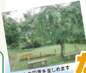
里山の四季を楽しめます

井田山は、中原区の西部多摩丘陵東端に位置しています。山頂部のクヌギやコナラ林、斜面緑地、谷戸の小川などの自然が残る貴重な里山です。また、区の「市民健康の森」にも指定されています。開発が進む中原区に残された井田山の自然に触れてみませんか。 場所 中原区井田2の32 (市立井田病院隣接地) 交通手段 武蔵小杉駅からバス、井田病院行きで中原老人福祉センター入り口「下車」 (▶七面に関する記事あり)