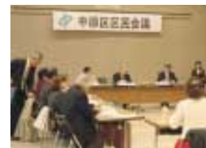
毎回、真剣な議論が交わされます

区民会議は、区民の代表が集まり、地域の課題について審議、検討を行います。第一回は、第三期区民会議をどう進めるかや取り上げる課題などについて検討します。