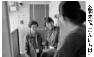
玄関先で「こんにちは」

新生児訪問を受けない家庭を対象に、研修を受けた地域ボランティアが訪問員として伺い、身近な子育て支援情報などをお届けしています。訪問を通して、赤ちゃんのいる家庭と地域の人との温かい交流が生まれています。