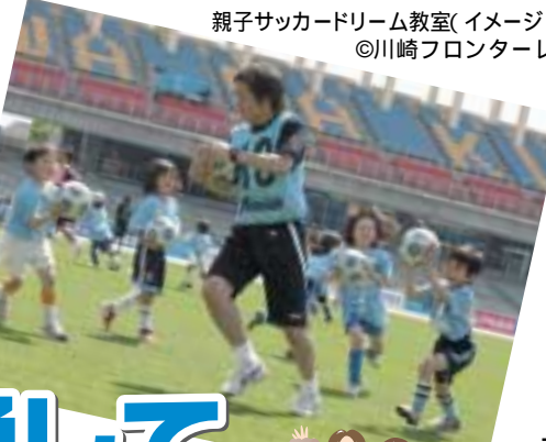
親子サッカードリーム教室(イメージ)