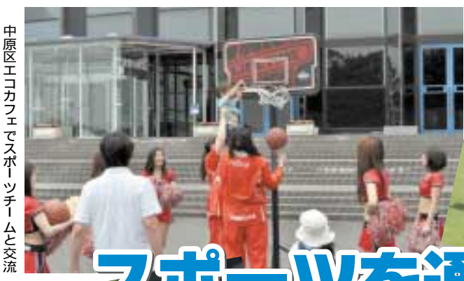
中原区エコカフェでスポーツチームと交流