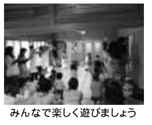
みんなで楽しく遊びましょう

対象 1～3歳の子どもと保護者 場所 中丸子神明大神(通称:中丸子神明神社)社務所(中丸子492) 日時 毎月第4火曜(8月は休み)午前10時～11時半