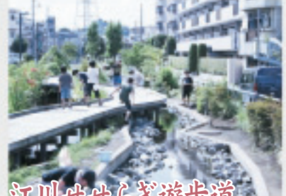
江川せせらぎ遊歩道 かつてニケ領用水の支川であった江川に平成15年、遊歩道が整備されました。