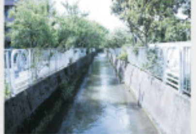
ニケ領用水 新田開発のために江戸時代につくられた県内最古の人工用水です。