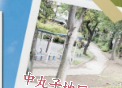
中丸子地区の緑道 暗渠(地下水路)の上に整備された緑道。地域のみなさんの努力で、花が絶えません。

中原区には、意外と知られていない隠れた魅力があります。区の観光ガイドがお薦めする魅力スポットを紹介します。