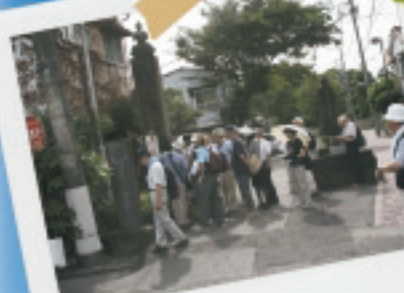
中原街道 街道沿いには江戸時代に御殿があった名残を見ることができます。