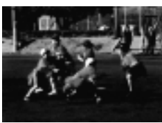
腰のフラッグを取れないように

ホークス倶楽部事務局 ☎(733) 1314。区役所地域振興課 ☎(744) 3346