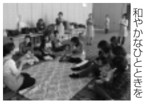
和やかなひとときを