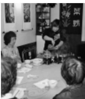
中国茶も楽しんで