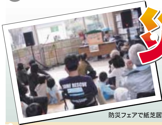
防災フェアで紙芝居