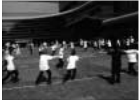
楽しく運動しましょう

運動普及推進員(ヘルスパートナー)は、区が実施している養成教室修了者で、運動を通じた健康づくり普及活動を行う地域のボランティアです。