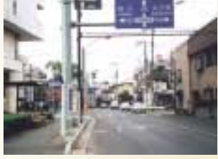
「平成10年9月の小杉十字路周辺」

区では、今年四月日に迎える区制四十周年を記念して、昔のまちなみを記録した写真集を作成しています。発行に先立ち、区の様子に分かる写真を紹介します。